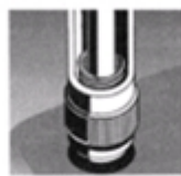
mit konventionellem Werkzeug