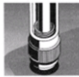
mit konventionellem Werkzeug