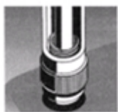
mit konventionellem Werkzeug