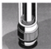
Einbau mit konventionellem Werkzeug